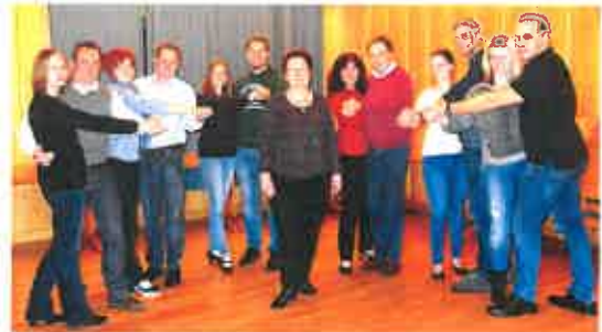
Sechs Paare erlernten beim Tanzkurs die Basis-Tanzschritte