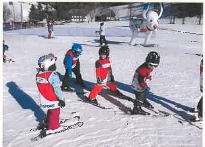
Aller Anfang ist schwer, daher beginnen die Kleinen am Zauberteppich, bevor es dann im Gelände zum Schneepflugtraining geht.