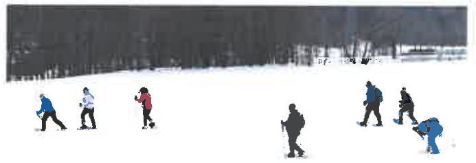
Die Schneeschuhwandergruppe in Aktion

Andere befinden sich gerade in der Planungsphase, z. B. Beitritt zum Verein Dorfservice, Jazzdance für Kinder und Jugendliche, Infobroschüre, Büchertauschbörse etc.