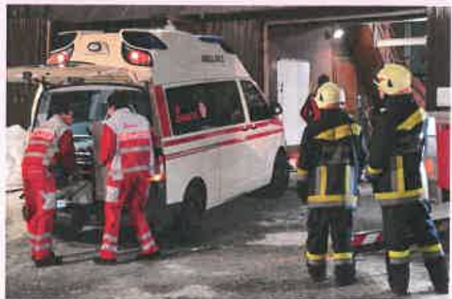
Einsatzübung der Johanniter Unfallhilfe am Falkert

Neben dem „Normalbetrieb“ wurde auch die Erste-Hilfe-Ausbildung weiter forciert: 769 Personen wurden von den Johannitern in insgesamt 63 Kursen geschult.