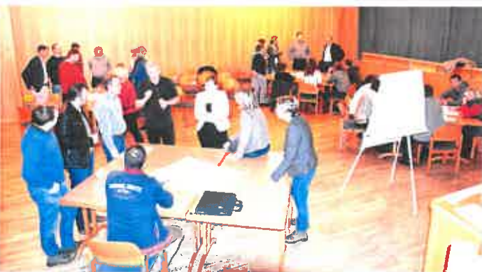
Die Projektgruppen bei den jeweiligen Thementischen