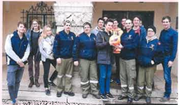
Mitglieder der FF-Gnesau bei der Ballonübergabe an die Physiker in München

Alle Projektbeteiligten waren glücklich, dass durch diese Hilfe das Abiturprojekt gerettet und jetzt auch abgeschlossen werden kann.