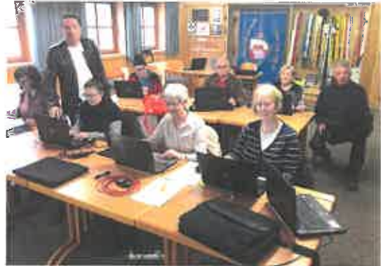
Die Teilnehmer des PC-Kurses in Kooperation mit der Volkshochschule Feldkirchen

Einige davon konnten bereits umgesetzt werden. Wie z.B. ein PC-Kurs für Anfänger, ein Tanzkurs und ein Schneeschuh-Schnupperkurs.