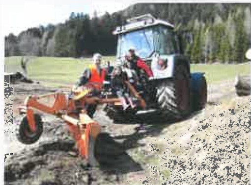
Wegpflegegerät im Einsatz

Kleinere Sanierungsmaßnahmen auf Schotterstraßen können mit dem vollhydraulischen Wegpflegegerät der WWG Gnesau (Standort Gunter Niederbichler, vlg. Daniel, Tel. 04278/312 oder Handy 0676 5483860) gegen eine Leihgebühr in Höhe von € 20,-/Halbtag oder € 40,-/Tag, mit oder ohne Trägerfahrzeug und Fahrer, nach Maschinenringtarif, in Eigenregie saniert werden.