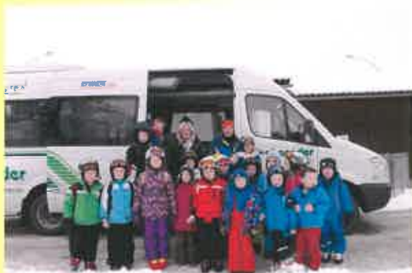
Auf die Ski und los.....früh übt sich, wer ein Meister werden will

CNC Wartbichler, Sportausschuss der Gemeinde Gnesau, Familienausschuss der Gemeinde Gnesau, Raiba Gnesau, BKS Bank Feldkirchen, Sparkasse Feldkirchen, Volksbank Feldkirchen