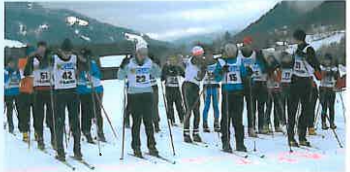
Die Langlaufteilnehmer bereiten sich auf den Start vor