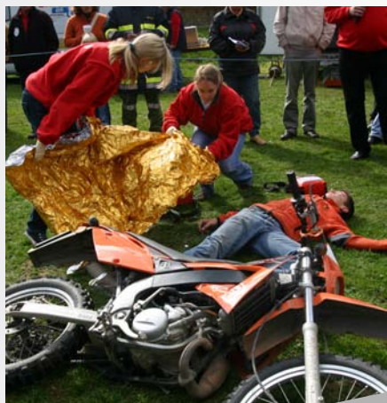
Stolz auf die Helfer beim Helfen!

Feuerwehr, Polizei, Rettung, das Hubschrauberteam und viele weitere Organisationen rund um das Thema "Sicherheit" konnten am 29. September in Gnesau durch die Vorführung ihres umfangreichen Programmes die Bevölkerung stark beeindrucken.