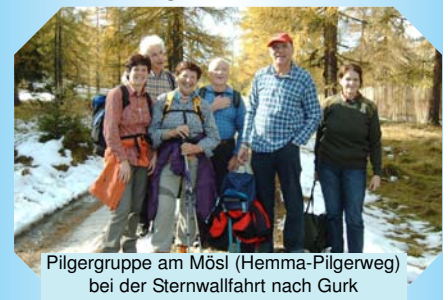
Pilgergruppe am Mösl (Hemma-Pilgerweg) bei der Sternwallfahrt nach Gurk

* Erstellung der Gästeinformationsbroschüren, des Gastgeberverzeichnisses und des Veranstaltungskalenders